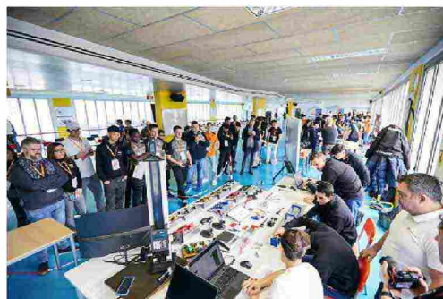
Prototipi di modellini di Formula 1 realizzati dagli studenti, insieme alle attività di progettazione, assemblaggio e formazione svolte con gli insegnanti

formazione iniziale, lo studio del regolamento e la preparazione tecnica della gara. Seguendo il progetto operativamente, sviluppano anche competenze organizzative di collaborazione e team working. «Abbiamo svolto una selezione in base alla motivazione a impegnarsi oltre le ore previste dal loro percorso biennale e quindi, come ITS Lombardia Meccatronica, abbiamo portato a bordo una ventina di ragazzi iscritti ai corsi di meccatronica, automazione e biomedicale, destinandoli ai vari ruoli in base a competenze e attitudini», prosegue Todeschini.